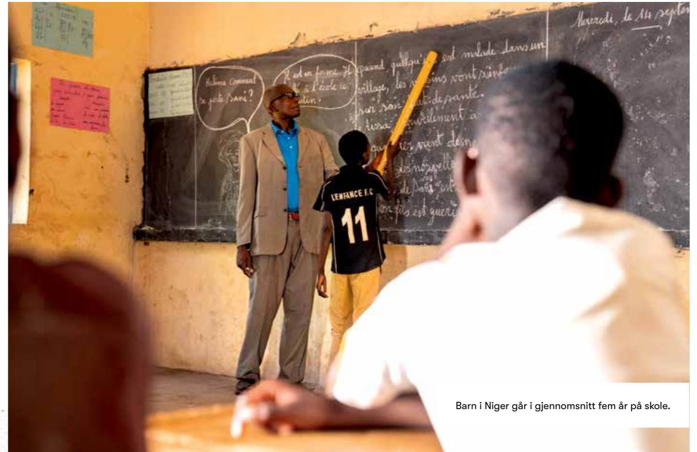
Barn i Niger går i gjennomsnitt fem år på skole.