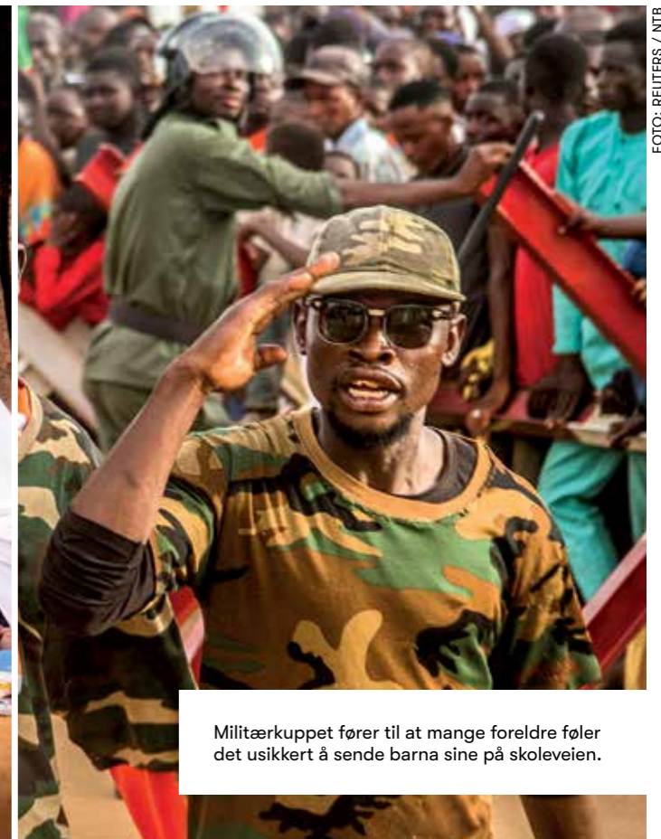
Militærkuppet fører til at mange foreldre føler det usikkert å sende barna sine på skoleveien.