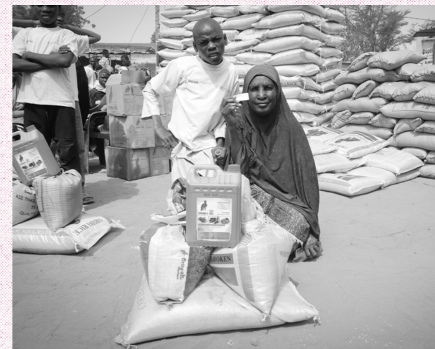
En av de 811 familiene som har mottatt mathjelp i Niger.

Klimaendringene rammer Niger kanskje mer enn noe annet land i verden. Her er 80 prosent av befolkningen avhengig av jordbruk. Den globale oppvarmingen betyr at landet er svært utsatt for matmangel, sult og fattigdom.