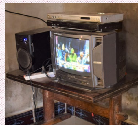
TV-EN ble med da familien skulle flytte fra det gamle huset til det nye.