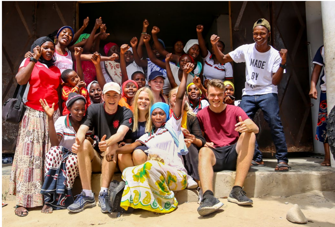
Norske elever i møte med ungdommer fra Tanzania.