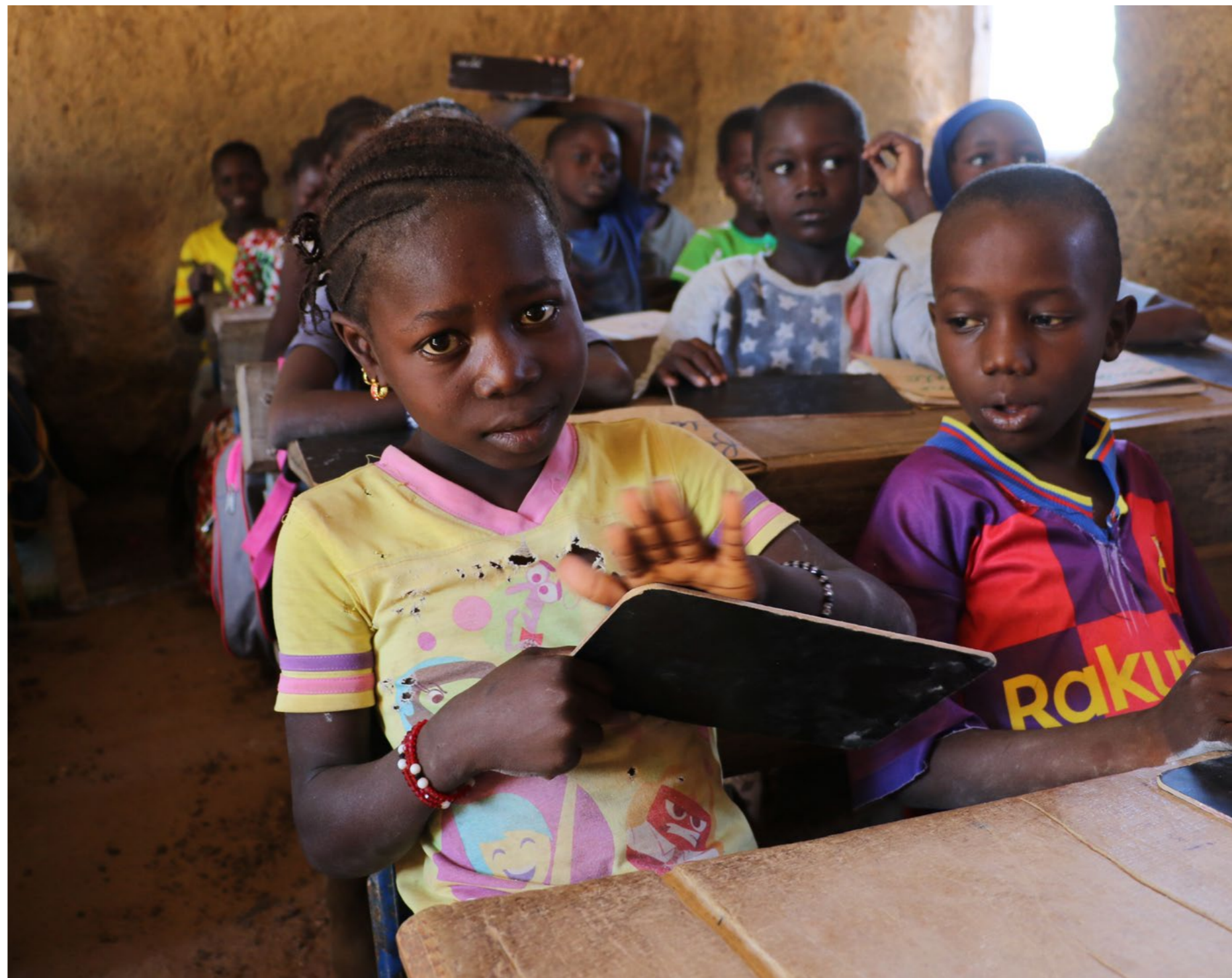
Makoro er heldig og en av dem som har fått begynne på Speed School og lære å lese og skrive.

– Tenk om jeg kunne bli lege en dag, tenk om jeg hadde klart det, sier hun med et forsiktig smil.