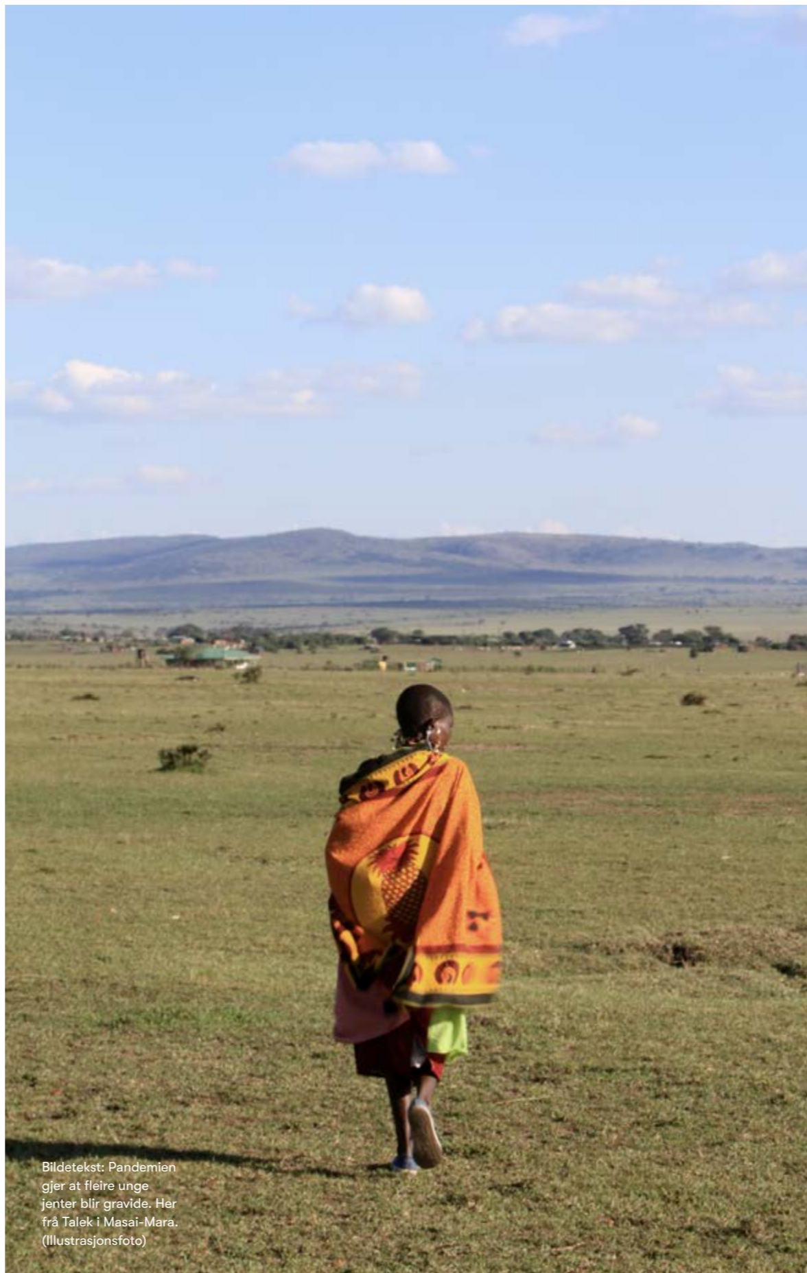
Bildetekst: Pandemien gjer at fleire unge jenter blir gravide. Her frå Talek i Masai-Mara. (Illustrasjonsfoto)

Han er spent på kor mange som kjem tilbake når skulane opnar att.