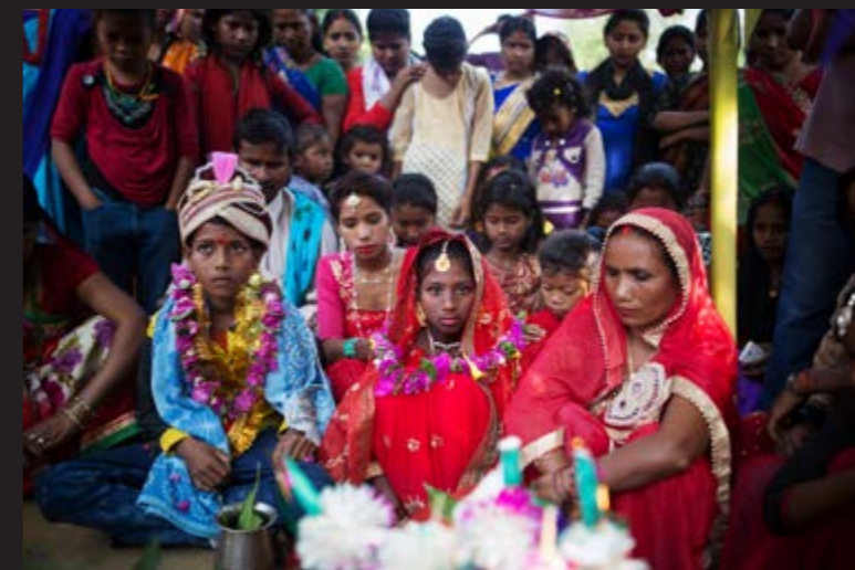
NEPAL FN anslår at koronapandemien kan føre til sterk økning i antall barneekteskap. I Nepal gjør pandemien at enkelte fremskynder barneekteskap fordi de må ha færre gjester. Dermed blir en ofte dyr fest noe billigere. Dette bildet er arrangert. Innbyggerne i denne landsbyen stilte velvillig opp for å hjelpe oss å sette søkelys på dette viktige temaet.