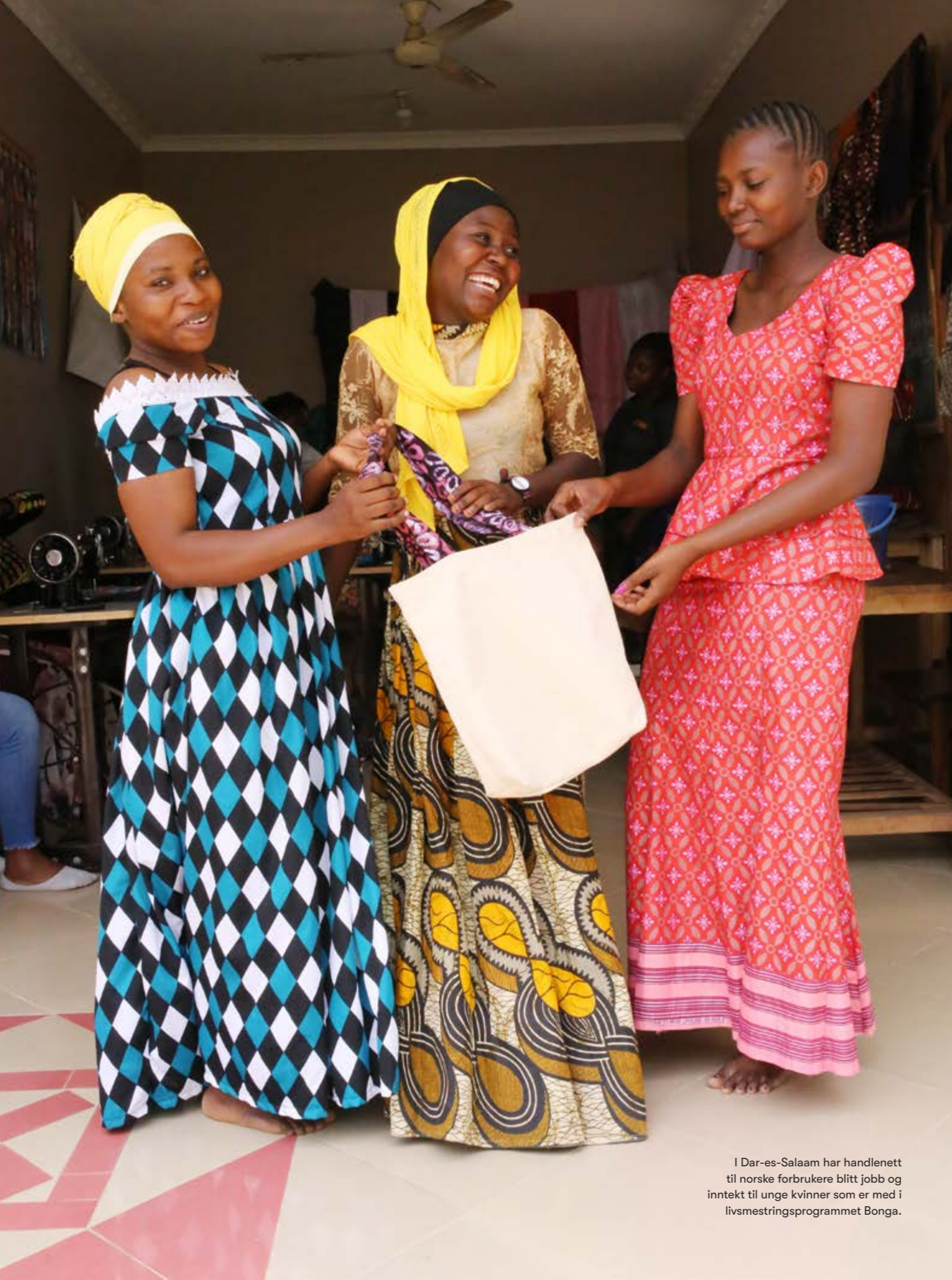
I Dar-es-Salaam har handlenett til norske forbrukere blitt jobb og inntekt til unge kvinner som er med i livsmestringsprogrammet Bonga.