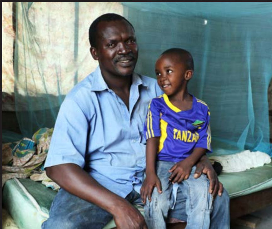
TANZANIA En far og en sønn. Bildet ble tatt i en landsby utenfor Dar-es-Salaam i Tanzania. Gutten gikk i førskolen. Etter endt skoledag ble sønnen hentet av far. Hjemme kunne han være sammen med pappa, og etter at han hadde matet endene og hønene og sett litt i boken han hadde med hjem fra førskolen, kunne han kose seg på pappas fang. Et herlig øyeblikk med gode følelser.