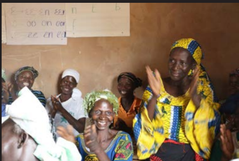
BURKINA FASO Glede! Når bokstavene får mening og setningene får innhold forandrer også verden seg. Kvinnene i denne klassen har aldri lært å lese og skrive. På markedene har de blitt lurt fordi de ikke kunne tallene og bokstavene. Nå får de voksenopplæring og lærer bokstavene og tallene. – Nå skal ingen få lure meg på markedet lenger, sier en av kvinnene.